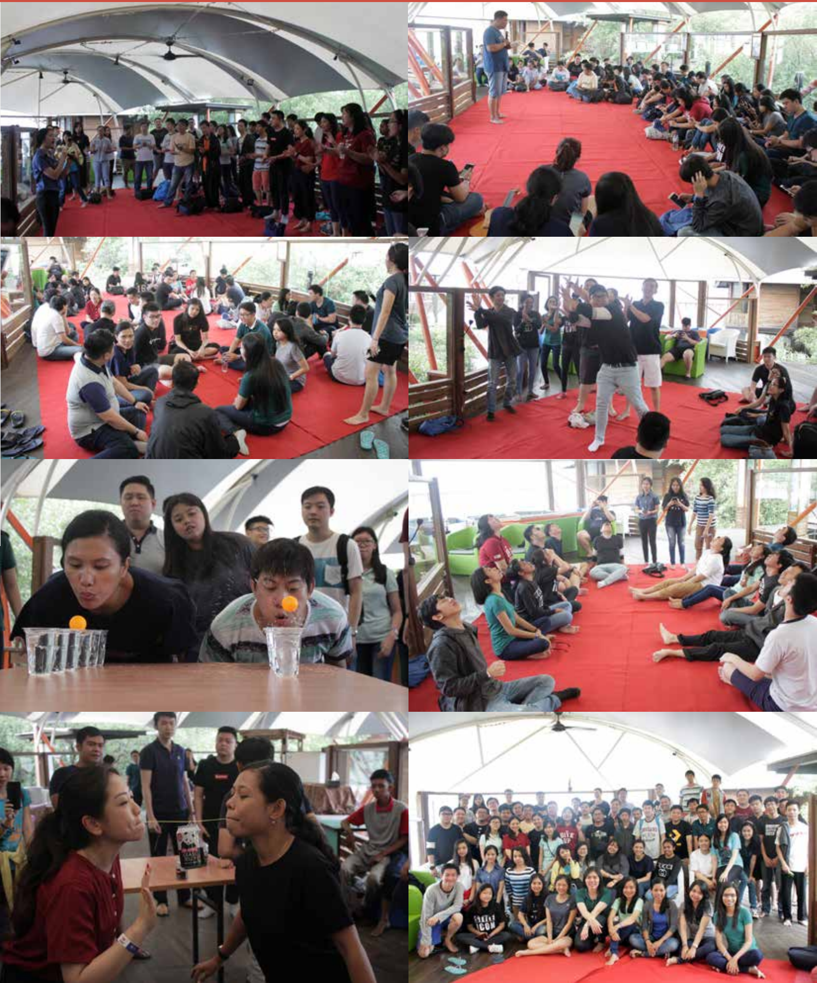
Kamis, 7 Maret 2019 Pemuda dan Remaja mengadakan PUT (Persekutuan Udara Terbuka) di Bee Jay Bakau Resort, Probolinggo dengan tema "See God's Creation", dengan peserta 62 orang. Selain beribadah, acara di isi dengan game dan menikmati pemandangan di BJBR.